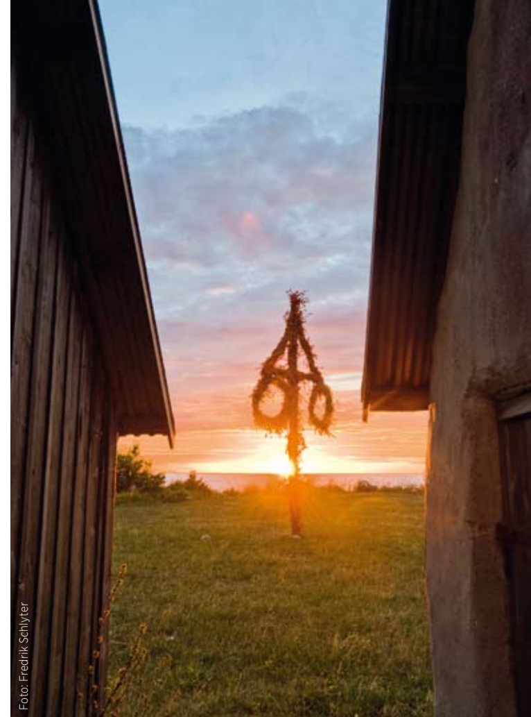
Komm, kleines Schwedenmädel, tanz mit mir: Mittsommernachtsfest am helllichten Tag (l.) und in der Ruhe der nicht finsternen Nacht (r.).