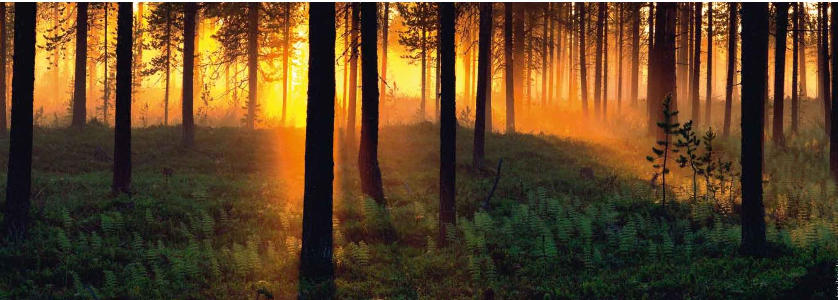
Mittsommernachtliche Stimmung in Schwedens Wäldern (l.). Dienen der Weinbereitung: Moosbeeren, Wacholderbeeren, Moltebeeren und Birken (v.o.n.u.).