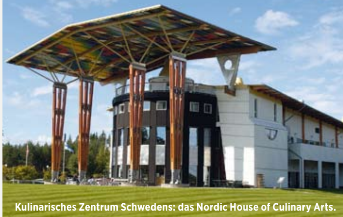
Kulinarisches Zentrum Schwedens: das Nordic House of Culinary Arts.